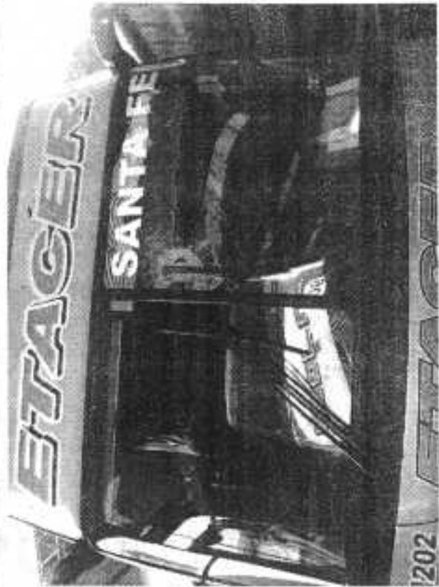
Temor en la ruta. Pasajeros y chofer pasaron un mal momento en la 168.

Debido a esto, el coche se trasladó hasta el puesto de Gendarmería Nacional Colastiné, donde se embarcó a los pasajeros y al chofer, quien fue trasladado para control a la Clínica La Entrerriana, de la ciudad de Paraná. No hubo pasajeros heridos. Desde la empresa se están tomando todas las medidas necesarias para evitar estos hechos lamentables.